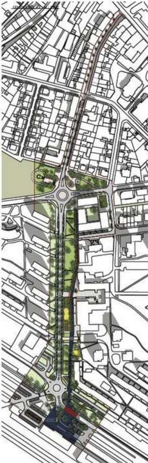
STŘIŽNICE M 1 : 10 000