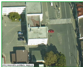
zdroj mapového podkladu: mapy.cz

Řešení pomocí miniokružní křižovatky všechny tyto nedostatky a nebezpečí odstraní. Úpravu lze provést za období 14ti dnů s investičními náklady do 500 tis. Kč.